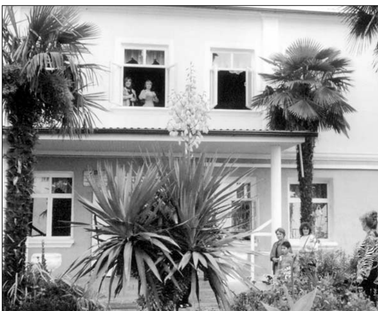
Армянская школа в Адлере.

ных соответствия содержания форме остаются за рамками таких данных. В г. Сочи согласно переписи 2002 г. проживает более 15 тыс. детей армян в возрасте от 7 до 17 лет, тогда как в армянской школе и отделениях училось всего на тот же период всего около 1380 учащихся, то есть 9% 43 . При этом, в адлерской армянской школе в последние 3 года отсутствовало преподавание уроков истории армянского народа, а армянская ли-