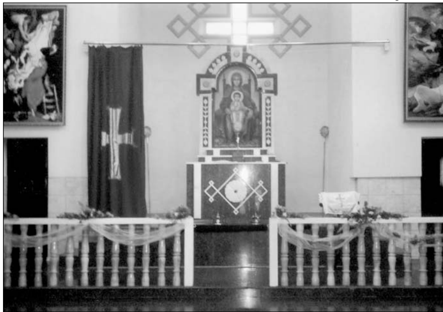
Армянская церковь в Адлере.

сравнению, например, с казачьими или адыгейскими, не говоря уже о бытовой дискриминации или нарушении прав человека по культурной и расовой принадлежности 39 .