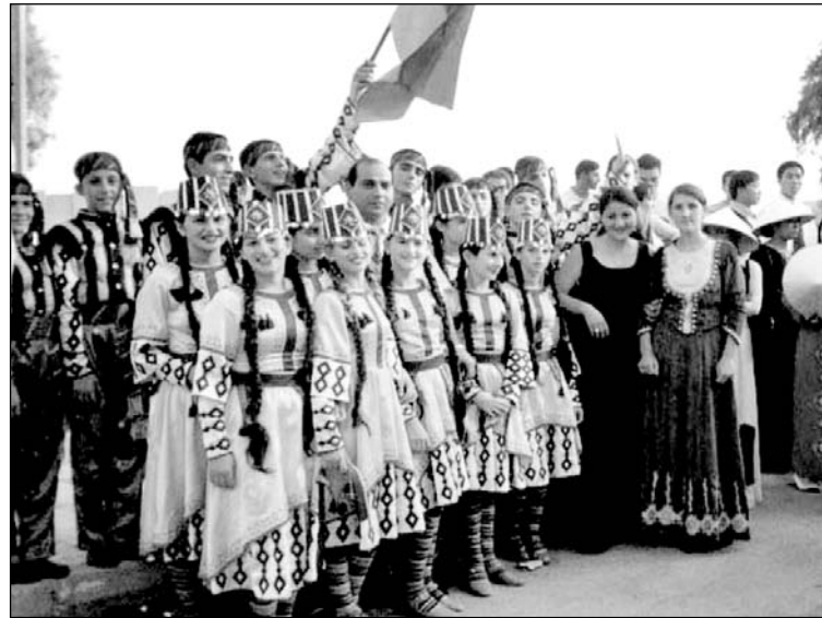
Ансамбль "Напри", Лазаревск.

Крупнейшая в крае субэтническая группа амшенских армян, выходцев из бывшего Трабзонского вилайета Турции, насчитывает до 160-200 тыс. человек, по-прежнему сохраняет региональную и культурную специфику, но незначительно втянута в сферу обще-армянского культурного единства в силу культурных и политических факторов. Эта группа ассоциирует себя как коренное население края и, особенно, Черноморского побережья 8 . Подобную же характеристику имеют карские, артинские, трабзонские, чорохские (байбуртские, испирские), ванские, эрзинджанские (ерзнкайские) и эрзурумские (каринские) старожильческие группы армян края, насчитывающие до 40-50 000 человек 9 . К специфике этих групп также относится тот факт, что только среди них часть населения живет в сельской местности и занимается земледелием. Особенно, это свойственно амшенским армянам, образующим