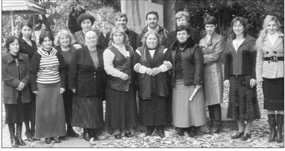
Ալահաձի գյուղի հայկական դպրոցի մանկավարժները:

Հասարակական կյանքի զարգացմանը զուգընթաց՝ ճախողությամբ են ստեղծվում Սուխում քաղաքում դպրոց հիմնադրելու համար: Զայ կյանքի ու մշակույթի աչքի ընկնող դեմքեր Զովսեփ Կարապետի Այվազովը, Տեր Ավետիս Տեր-Մկրտչյանը և ուրիշներ 1904թ. դիմում են Սուխումի քաղաքային դումային՝ դպրոցի և եկեղեցու կառուցման համար հողամաս հատկացնելու խնդրանքով: 1906 թվականի հուլիսի 26-ին դուման հայ համայնքի ներկայացուցիչներ Վ. Ծատուրյանին, Ա. Գուլյանին, Զ. Մուսոյանին, Տ. Ծատուրյանին և Մ. Ալբուսյանին հատկացնում է այդ հողամասը: 1906 թվականի սեպտեմբերի 1-ին սկսվում են պարապմունքները: Առաջին տարում նորաբաց դպրոցում սովորել են 33 աշակերտներ (ուսուցիչներ՝ Զարուբյուն Տեր-Զարուբյունյան, Մանուշակ Գալայան): 2006 թվականին դպրոցը նշեց իր փառապանծ 100-ամյա հոբելյանը: Սուխումի Զովհաննես Թումանյանի անվան դպրոցն են ավարտել գիտության և մշակույթի ակադեմիկոս գործիչներ, պետական մրցանակի դափնեկիրներ: Զիշենք մի քանիսին. Սուրեն Կլորիկյան-տեխնիկական գիտությունների դոկտոր, երեք անգամ արժանացել է ԽՍՀՄ պետական մրցանակի: Կարապետ Բոստանջյան - փիլիսոփայական գիտությունների դոկտոր. երկար տարիներ դասավանդել է Երևանի պետական մանկավարժական ինստիտուտում: Գրիգոր Մաղաքյան-բժշկական գիտությունների դոկտոր: Զայկազ Ութմազյան պատմական գիտությունների դոկտոր-պրոֆեսոր, դասավանդել է Երևանի պետական համալսարանում, ղեկավարել է Զայաստանի հրատարակչությունների պե-