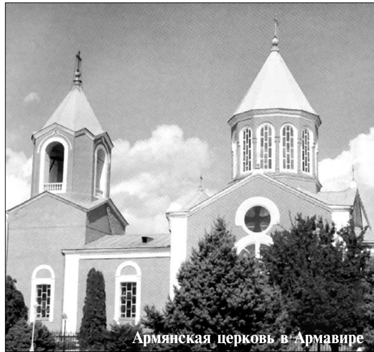
Армянская церковь в Армавире

Другая волна армянских переселенцев была из Крыма. Переправившиеся через Черное море, Керченский пролив, Азовское море и расселившиеся по степям Юга России по приглашению Екатерины Второй, они основали множество поселений, среди которых Нор - Нахичевань близ Ростова, город Армавир, который в адыгейских преданиях упоминается